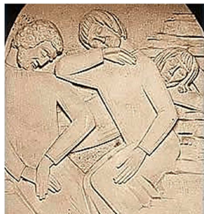
5ª estación. Vía Crucis Boucieu le Roi

>>> Esta oración del Beato Pedro Vigne puede acompañar y ritmar nuestro caminar hacia Pascua. También puede ayudarnos a acoger el MENSAJE DEL PAPA FRANCISCO PARA ESTA CUARESMA. Mensaje concreto para vivir con mayor convicción y compromiso este tiempo litúrgico.