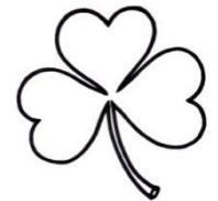
Le shamrock de St Patrick Symbole de la Trinité

Le chrétien commence sa journée, ses prières et ses actions par le signe de la croix, " au nom du Père et du Fils et du Saint Esprit. Amen ". Le baptisé voue la journée à la gloire de Dieu et fait appel à la grâce du Sauveur qui lui permet d'agir dans l'Esprit comme enfant du Père. Le signe de la croix nous fortifie dans les tentations et dans les difficultés. Cat.Egl.Cat. 2157