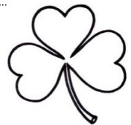
Il trifoglio di San Patrizio simbolo della Trinità

"Il Cristiano incomincia la sua giornata, le sue preghiere, le sue azioni con il segno della croce, "nel nome del Padre e del Figlio e dello Spirito Santo. Amen". Il battezzato consacra la sua giornata alla gloria di Dio e invoca la grazia del Salvatore, la quale gli permette di agire nello Spirito come figlio del Padre. Il segno della croce ci fortifica nelle tentazioni e nelle difficoltà". Catechismo Chiesa Cattolica 2157.