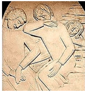
5ª estação Via-Sacra Boucieu le Roi